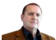
Gilbert Leduc , Le Soleil

(Québec) Après avoir obtenu le feu vert des autorités japonaises pour commercialiser son fil guide muni d'un capteur optique pour mesurer la pression sanguine dans le corps d'un patient suivi par un cardiologue, Opsens voit les portes de l'Europe s'ouvrir à elle.