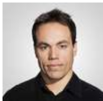
RICHARD DUFOUR LA PRESSE

OpSens vient d'obtenir l'autorisation de la Food & Drug Administration (FDA) des États-Unis pour l'utilisation de son nouveau fil guide dans les procédures de remplacement de la valve aortique par cathéter.